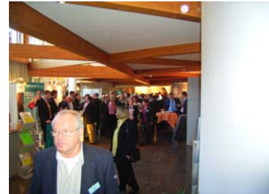
Austellerbesuch im Foyer