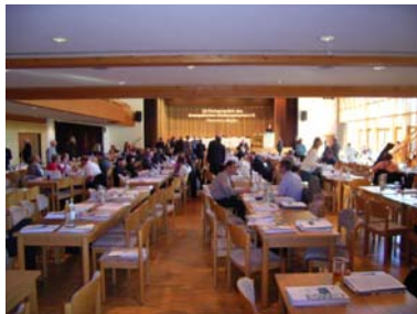
600 Teilnehmer benötigen viel Platz

Bei den Fachvorträgen konnte man allerdings den Eindruck gewinnen, dass die Referenten wohl gehofft hatten, schon über die neue WEG-Novelle referieren zu können, wenn die Tagung in Fischen statt findet. Denn die Vertragsinhalte zeichneten sich durch eine gewisse Hilflosigkeit aus, noch etwas Neues im Regierungsentwurf von 2005 zu finden.