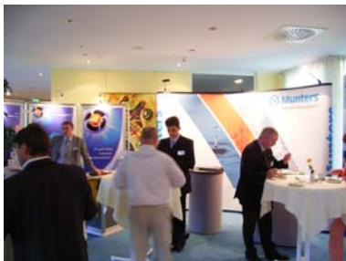
Ausstellung im Foyer des Atlanta Hotels

Am 6.10.06 fand im Atlanta – Hotel in Wachau die VdiV-Fachveranstaltung „Betonsanierung – Fassaden – Haustechnik“ statt. Da es mehrere Arbeitskreise gab, in denen unterschiedliche Vorträge gehalten wurden, musste man sich letztlich für Beton- und Fassadenanierung oder den Bereich Wasser, Abwasser Haustechnik entscheiden.