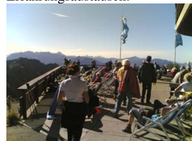
Kür zur Pflicht auf dem Nebelhorn

Am nächsten Tag reichten die Aussteller Apfelstrudel mit Vanilleeis und luden zum Themenabend, der in diesem Jahr (auf bayrisch: heuer) Österreich unterstellt war. So tischte die Küche der Stadthalle „Fiscina“ Wiener Schnitzel mit österreichischem Wein und Apfelstrudel zum Nachtisch auf. Anschließend ging es noch ins „Postsstüberl“ oder anderen gemütlichen Kneipen im Ort zum fachlich leichter fallenden Erfahrungsaustausch.