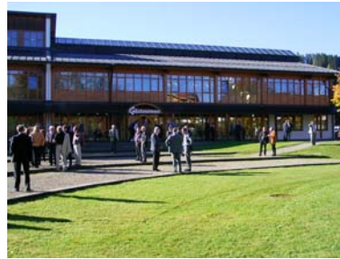
Interessante Gespräche in der Pause

früher gegen alle Wohnungseigentümer zu richten sei. Als Lüke schließlich die Frage aufwarf, ob der Rasenmäher einer WEG wirklich zum Verwaltungsvermögen zu rechnen sei, sahen sich einzelne Verwalter gezwungen den Saal zu verlassen.